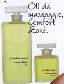
Oli da massaggio, Comfort Zone.