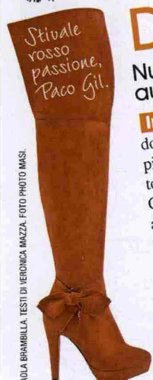
A CURA DI PAOLA BRAMBILLA. TESTI DI VERONICA MAZZA.