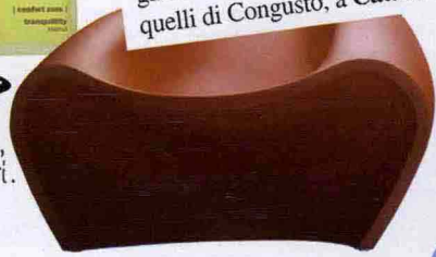
Poltrona Lovely, Parri.