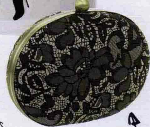
Clutch in pizzo, Accessorize.