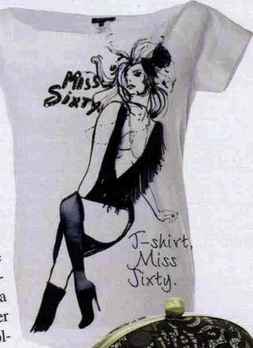
J-shirt, Miss Sixty.