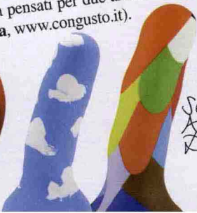
Sex toys, Angélique DeVil.